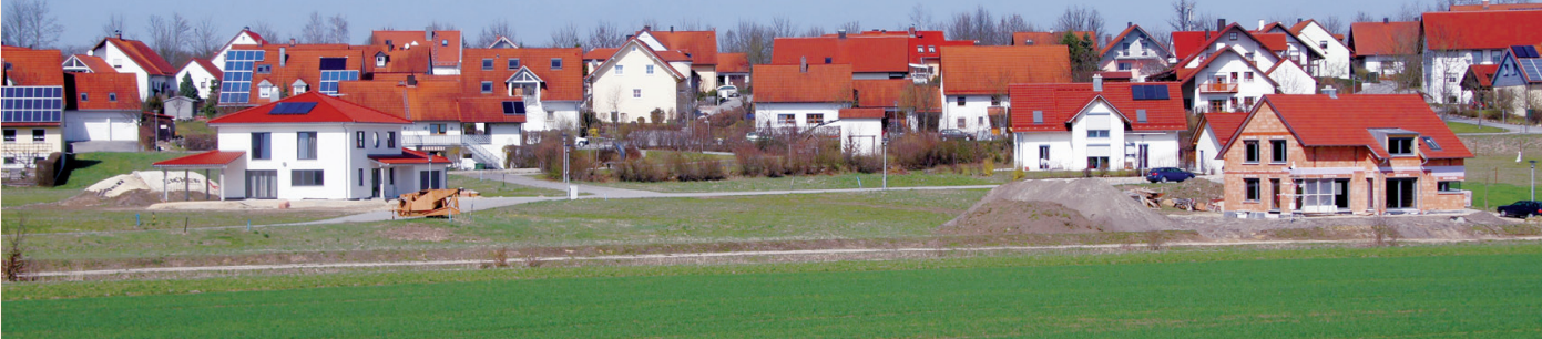
■ Grundstücke an der Sonne im Wohngebiet „Am Hochweg“ Schierling/Unterdeggenbach

SCHIERLING. Rechtzeitig zum Frühjahr und zum Einsetzen der Bau-Aktivitäten stellt der Markt Schierling im Wohnbaugebiet Eggmühl/Unterdeggenbach auch kleine Grundstücke zur Verfügung. Schon für 33.000 Euro ist ein Bauplatz zu bekommen. Das wichtigste dabei ist, dass darin schon alle (!) Kosten enthalten sind für Grundstück, Straßenschließung, Kanalisation und Wasserversorgung.