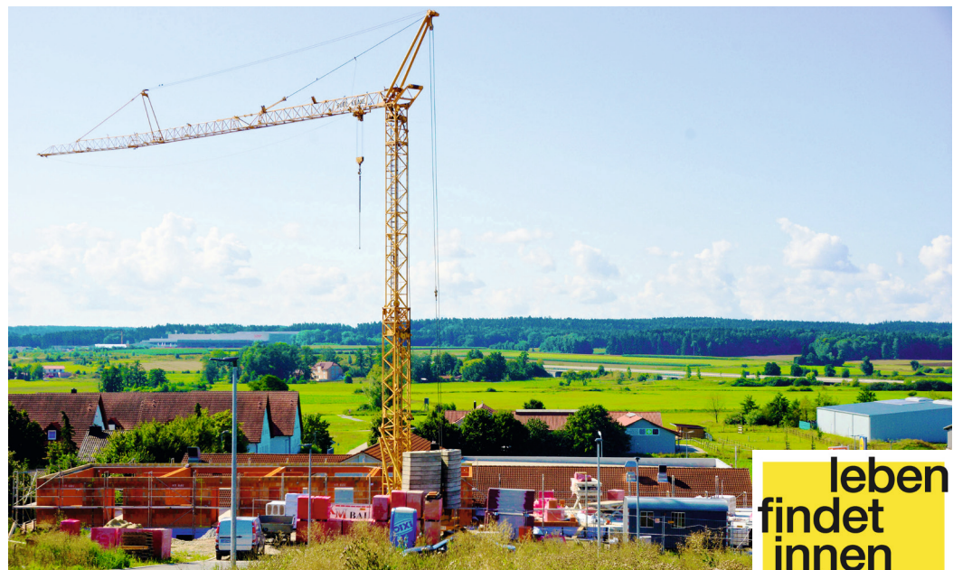
Im Schierlinger Wohngebiet „Markstein Südwest“ entstehen viele weitere Wohnungen – mit Blick in die Laberaue und unmittelbar an einer Nahversorgung