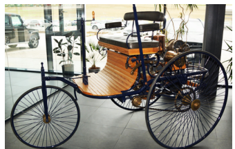
Astaller Classic stellt das erste Auto der Welt aus

SCHIERLING. Das Autohaus Astaller öffnet am Marktsonntag von 12 bis 17 Uhr sein Autohaus und zeigt die aktuellen Mercedes-Modelle ebenso wie das erste Auto der Welt. Karl Benz, der Sohn eines Lokomotivführers, hat es im Jahre 1885 selbst gebaut. Am 29. Januar 1886 meldete Benz sein „Fahrzeug mit Gasmotorenbetrieb“ zum Patent an. Im Juli 1886 erfolgte die erste öffentliche Ausfahrt des dreirädrigen Benz Patent-Motorwagens. 1888 fuhr Berta Benz, die Frau des Erfinders, zusammen mit ihren Söhnen etwa 90 Kilometer von Mannheim nach Pforzheim, um der Welt zu beweisen, dass dem „Pferdelosen Wagen“ die Zukunft gehören wird.