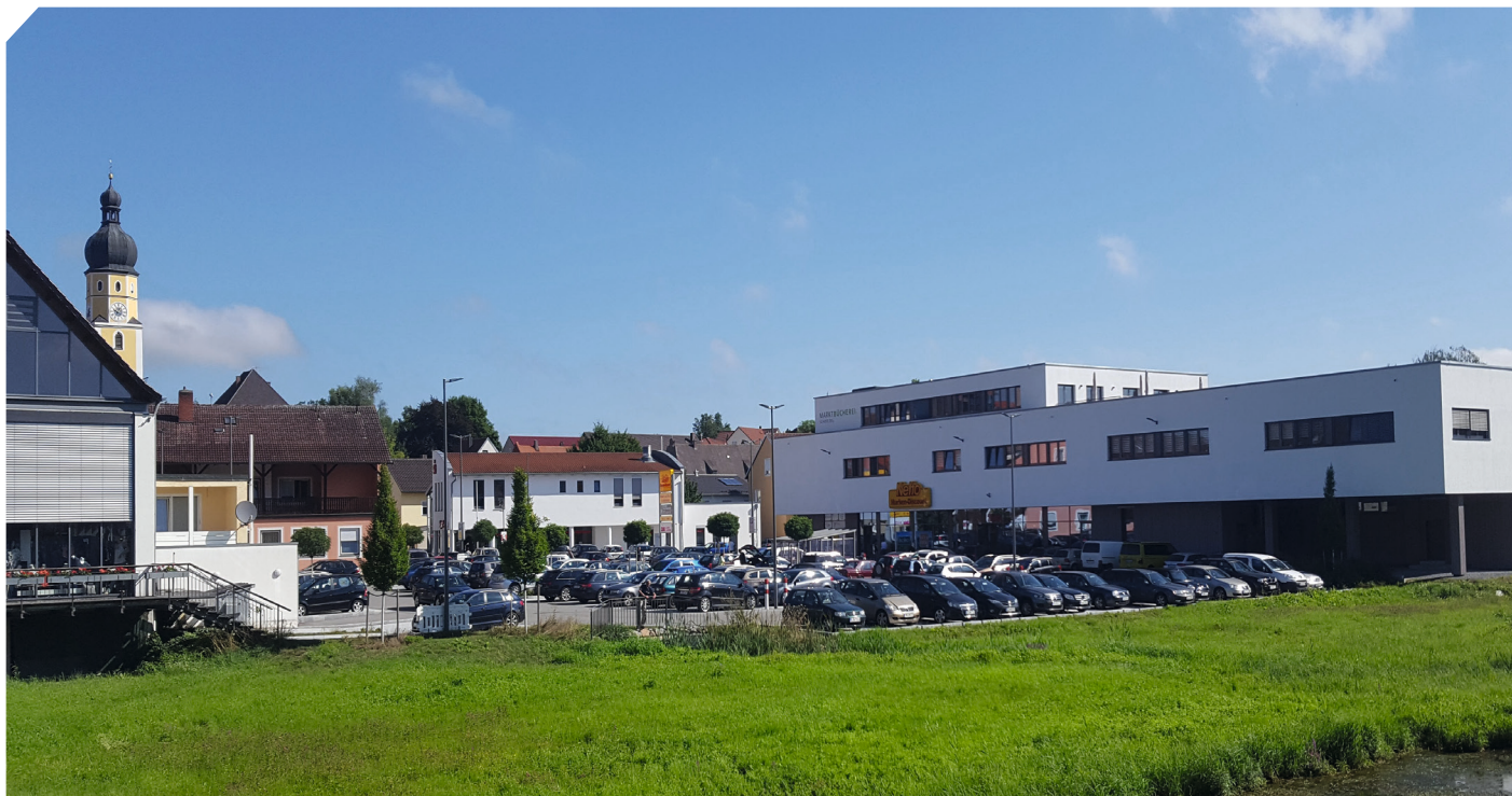
Im Schierlinger Ortskern ist das neue Geschäfts- und Bürgerhaus mit Arztzentrum der markanteste Hinweis auf die positive Fortentwicklung der letzten 20 Jahre

SEIT 20 JAHREN BÜRGERBETEILIGUNG ZUR GEMEINDEENTWICKLUNG – JUBILÄUM ENDE MAI