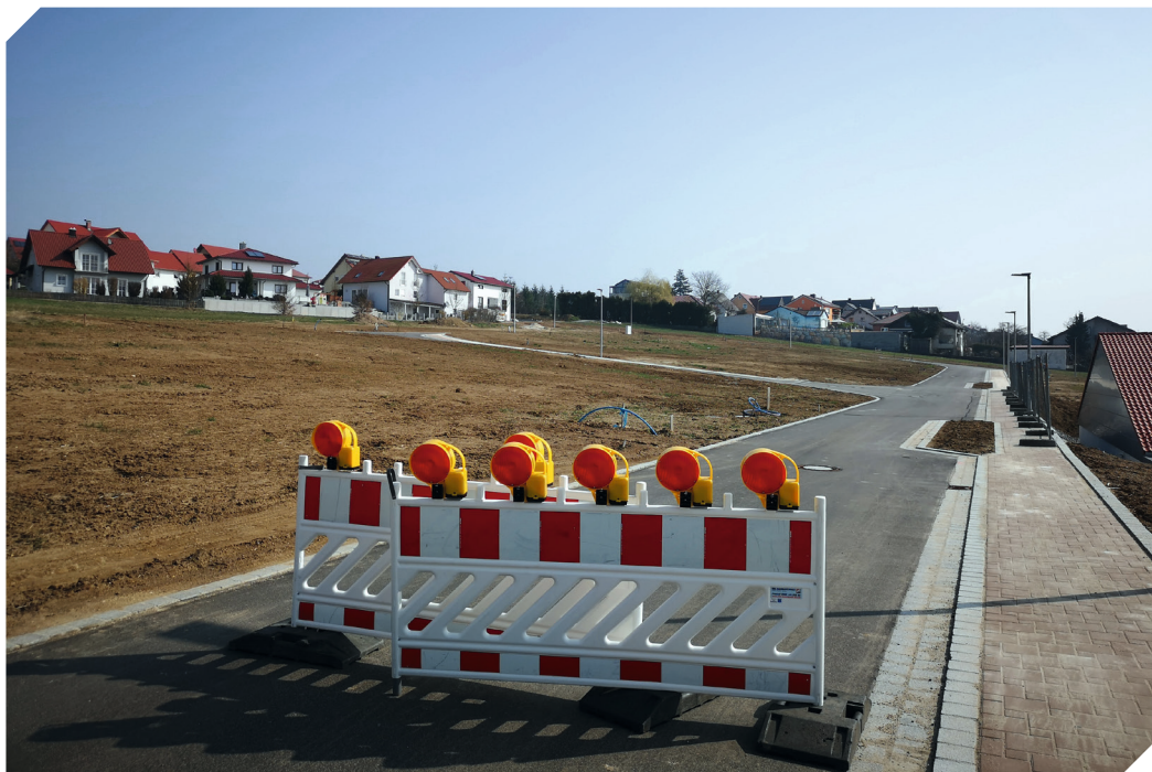
Im Schierlinger Wohnbaugelände „Am Regensburger Weg“ wurden Parzellen für Einzelhausbebauung sowie für den Mietwohnungsbau erschlossen. Gleichzeitig wurde die Chance eröffnet, dass sich Lidl und Müller erweitern konnten bzw. können.

SCHIERLING. Über 200 neue Wohnungen sind in den letzten Jahren im Ort Schierling entstanden. Die Zahl der Einwohner ist um rund 900 angestiegen. Vor allem deshalb, weil von der Gemeinde sowohl innerorts - vor allem auf dem „Nock-Grundstück“ - als auch an den Ortsrändern weiteres Wohnbauland ausgewiesen wurde. Außerdem weil mehrere private Investoren Baulücken im Ortskern genutzt und darauf sowohl viele Miet- als auch Eigentumswohnungen errichtet haben.