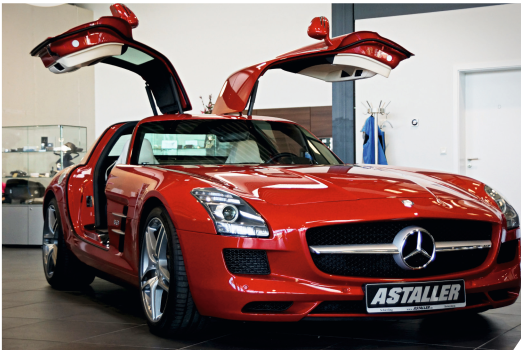
Eines der Highlights wird der rote SLS AMG Coupé mit Flügeltüren sein

und zwar vom Rohbau bis zur Fertigstellung. Vor Beginn einer Restaurierung wird jedes Fahrzeug von der Classic-Abteilung sorgfältig geprüft und zertifiziert. Es geht dabei sowohl um die Authentizität als auch den Zustand. Jeder Astaller Classic Mitarbeiter ist ein Spezialist mit einzigartigen Fertigkeiten und Teil eines Service-Teams, in dem für jede Herausforderung die richtige Lösung gefunden wird.