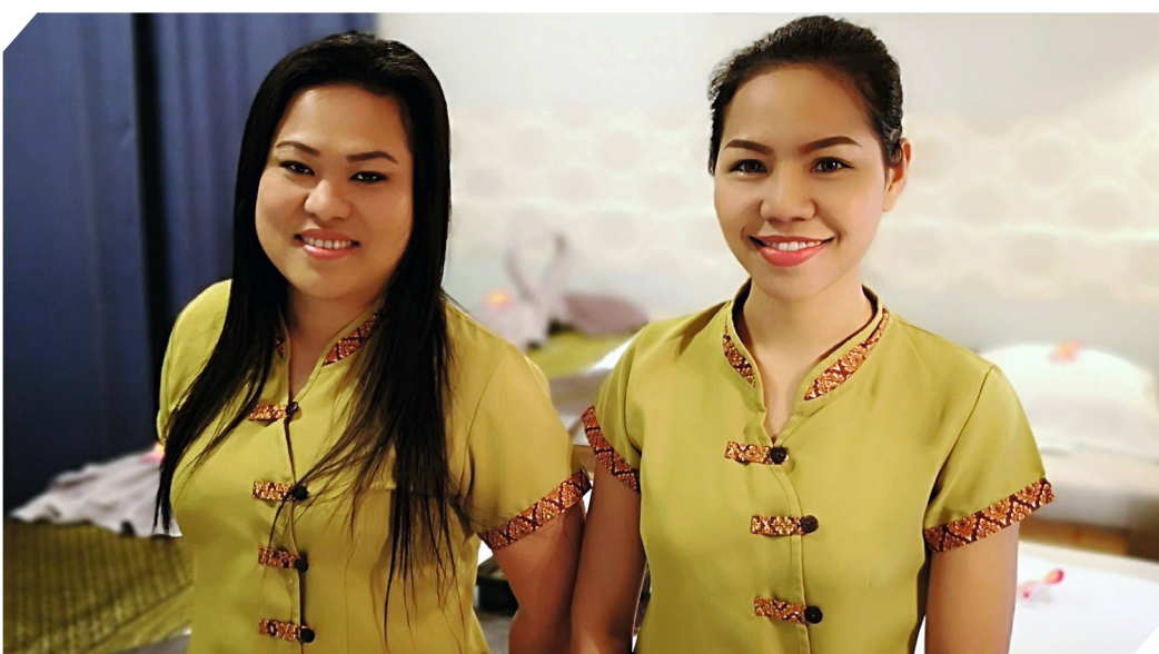
Im Zentrum Schierlings hat die „Parn Cheeva Thai-Massage“ eröffnet

SCHIERLING. In dem Gebäude zwischen der Metzgerei Resch und dem Friseursalon Rammel haben zwei charmante Damen die „Parn Cheeva Thai Massage“ eröffnet. Schon nach wenigen Wochen haben sie sich mit ihren hochwertigen Angeboten einen ausgezeichneten Ruf erworben und manche Stammkunden gewonnen.