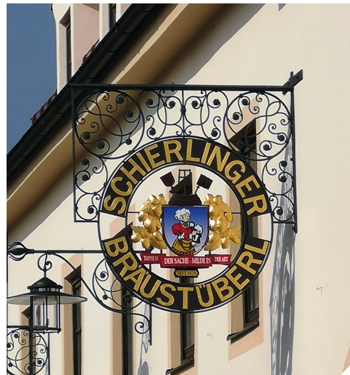
Auch private Investoren tragen zur Erneuerung bei

SCHIERLING. In den letzten 20 Jahren hat Schierling seine Funktionen deutlich gestärkt und sein Gesicht entscheidend verändert. Grundlage dafür waren zwei Bürgerbeteiligungsprozesse zur Gemeindeentwicklung mit Leitprojekten als „Master-Plan“. Engagement, Kontinuität und Verlässlichkeit haben dafür gesorgt, dass ein großer Teil des bis zum Jahre 2025 konzipierten Programms bereits erfolgreich umgesetzt werden konnte.