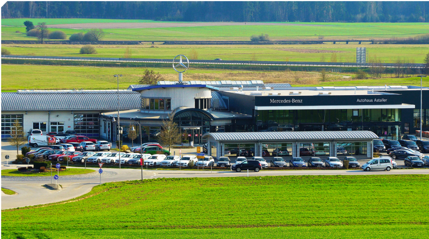
Das Autohaus Astaller liegt an der Anschlussstelle Schierling-Nord der B 15neu und lädt am Marktsonntag zur großen Autoschau ein

AM MARKTSONNTAG GROSSE AUTOSCHAU BEIM AUTOHAUS – AUCH MIT „CLASSIC“-MODELLEN