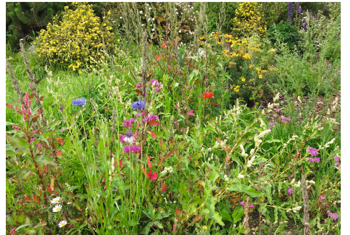
Am Marktsonntag gibt es kostenlose Samen für künftig blühende Flächen

Klimajugend „WirWollenMehr“ Markt Schierling Rathausplatz 1 84069 Schierling