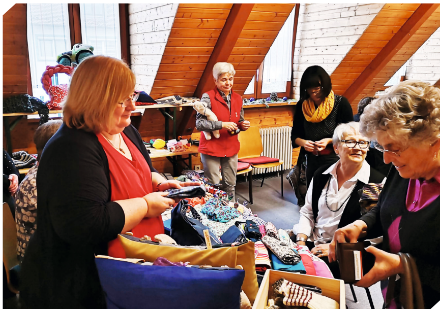
Insbesondere beim jährlichen Gemeindefest der evangelisch-lutherischen Kirchengemeinde werden die Erzeugnisse angeboten