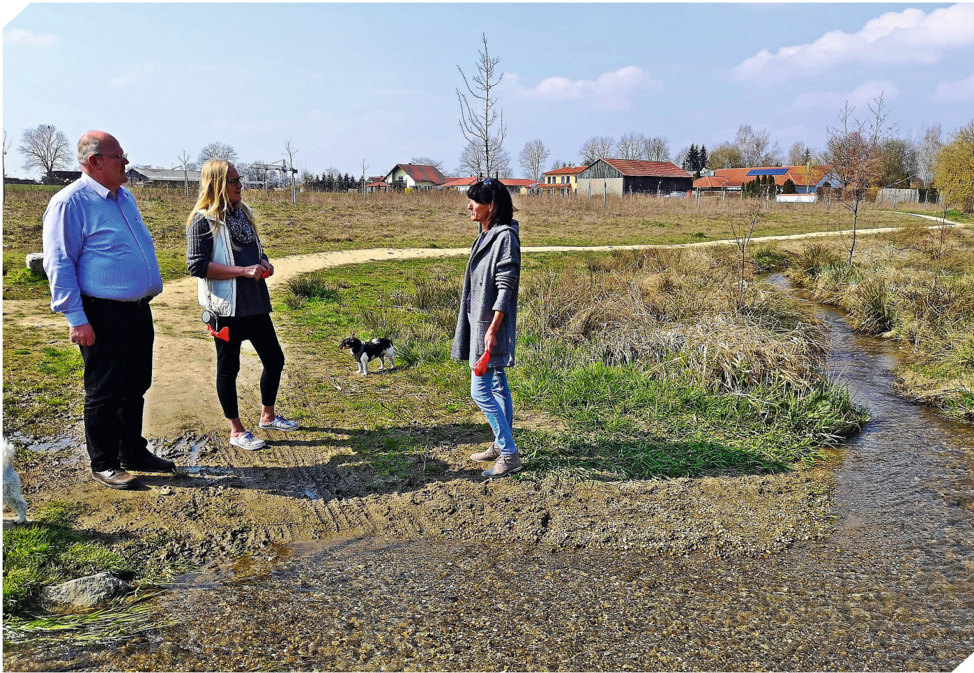
Noch bleibt im Frühjahr in Schierling am Allersdorfer Bach dem Auge verborgen, was im Sommer auf der naturbelassenen großen Fläche alles grünt und blüht

DIE KLIMA-JUGEND „WIRWOLLENMEHR“ VERTEILT KOSTENLOS EINE BLÜHMISCHUNG FÜR GARTEN UND FELD