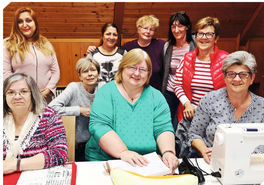
Die ökumenische Handarbeitsgruppe „Lustige Maschen“ trifft sich zweimal im Monat im evangelisch-lutherischen Gemeindezentrum und lädt zu jeder Zeit weitere Interessenten ein

SCHIERLING. Eine erstaunliche Kombination aus Wiederverwertung, Handarbeiten und Gutes tun schafft der offene ökumenische Handarbeitskreis „Lustige Maschen“. Kleidungsstücke, die an einigen Stellen durchgescheuert oder gerissen sind, bieten den annähernd 20 Damen genügend Rohstoff um Brieftaschen, Schlüsselmappen und andere Kleinigkeiten zu nähen. Omas „alte“ Kittelschürzen und ausrangierte Bettwäsche werden zu Einkaufstaschen, Leseknochen und Dinkelmäusen.