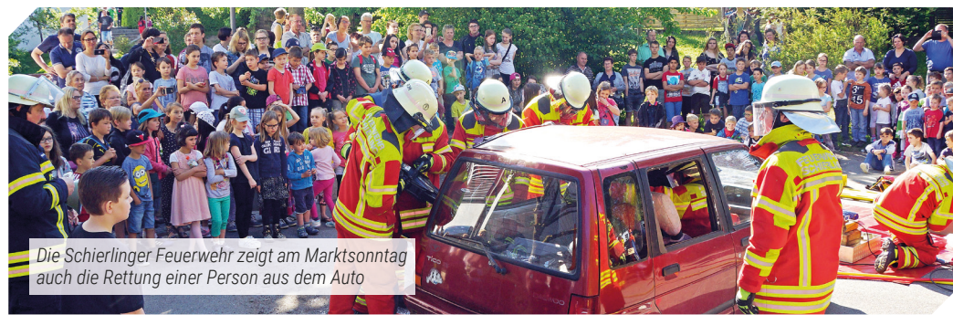
Die Schierlinger Feuerwehr zeigt am Marktsonntag auch die Rettung einer Person aus dem Auto