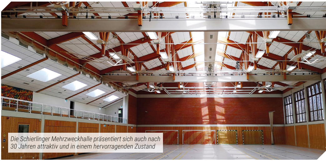
Die Schierlinger Mehrzweckhalle präsentiert sich auch nach 30 Jahren attraktiv und in einem hervorragenden Zustand