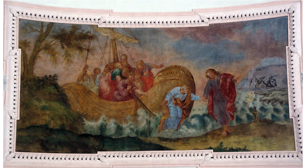
Ebenso „Petrus wandelt auf dem Meere“

SCHIERLING. Für die meisten Besucher wirkt die katholische Pfarrkirche auf den ersten Blick hell und doch etwas kahl. Bald aber erschließen sich einige Details des Kirchenraumes, die für den Gottesdienst große Vorteile bringen. Und es zeigt sich, dass die Innenausstattung - insbesondere die Deckenmalerei und der Stuck - von regionaler Bedeutung sind. Am Marktsonntag lohnt sich auch ein Blick in die Kirche auf dem Berg.