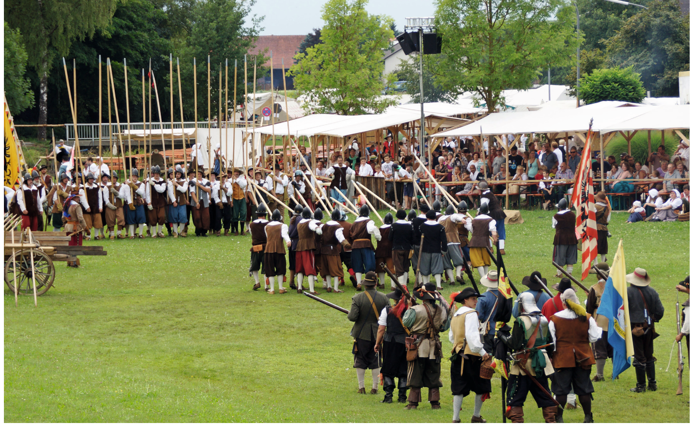
Einer der Höhepunkte des Gennßenker-Festes ist die Darstellung der Verteidigung des Feldlagers

Rund um diese Geschichte gibt es viel zu sehen: Feldlager werden aufgebaut, Gaukler, Zauberer und Jongleure treten auf, Musikanten und Komödianten sind zu hören und zu sehen. Immer mehr Schierlinger lassen sich auf den Rollentausch für drei Tage ein. Zugelassen sind allerdings nur Originalkostüme, die derzeit in der Nähstube des Vereins für Heimatpflege genäht werden. ●