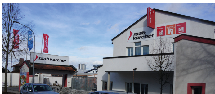
Außenansichten von Raab Karcher in Schierling