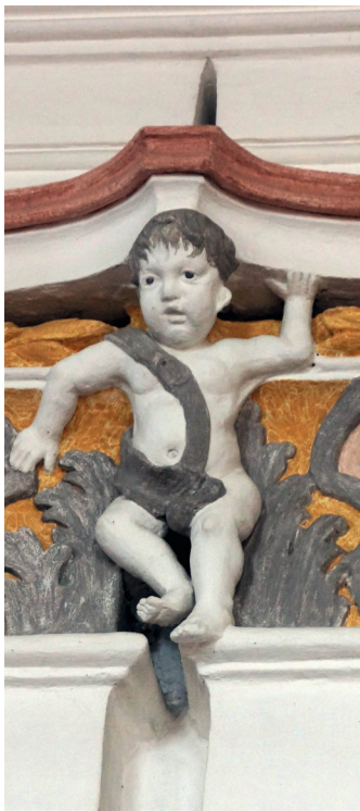
Der Stuck stammt aus der „Wessobrunner Schule“

Der Künstler ließ sich vor 288 Jahren vom Maurer immer einen bestimmten Teil des Putzes frisch herrichten, den er an einem Tag bemalen wollte. Die Grenzen eines solchen „Tagwerks“ sind zum Teil heute noch sichtbar. Damit der Künstler den Überblick behielt, hat er die Umriss eines Tagwerks in Originalgröße auf einen Karton vorgezeichnet und auf die noch feuchte Wand übertragen.