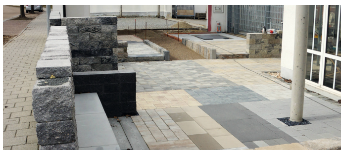
Garten- und Landschaftsbau