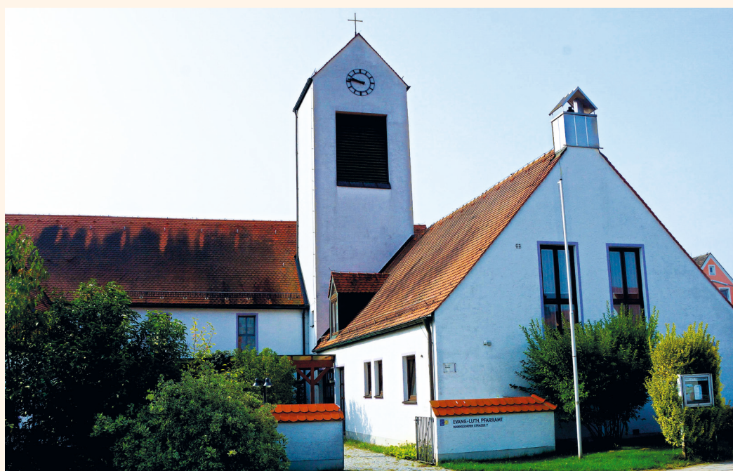
Die evangelisch-lutherische Pauluskirche Schierling

Martin Luther war durch und durch ein religiöser Mensch seiner Zeit. Nicht Gott stand bei ihm infrage, sondern das Verhältnis des Einzelnen zu Gott. Es ging Luther darum, eine durch spätmittelalterliche Frömmigkeitspraxis verdunkelte biblische Grundaussage wieder zur Geltung zu bringen: den Vorrang der unverdienten Gnade