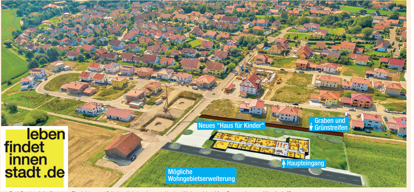
So könnte sich die neue Einrichtung städtebaulich in ein erweitertes Wohngebiet „Am Regensburger Weg“ einfügen

SCHIERLING. Der Markt Schierling bekommt ein weiteres „Haus für Kinder“ – und zwar mit 2 Kindergarten- und einer Kinderkrippengruppe. Wo? Im Anschluss an das neue Wohnbaugelände „Am Regensburger Weg“, also dort, wo jetzt viele junge Familien leben. Auf etwa 2,8 Millionen Euro ist die Investition veranschlagt. Baubeginn ist bald, denn die Fertigstellung ist bis September 2017 geplant.