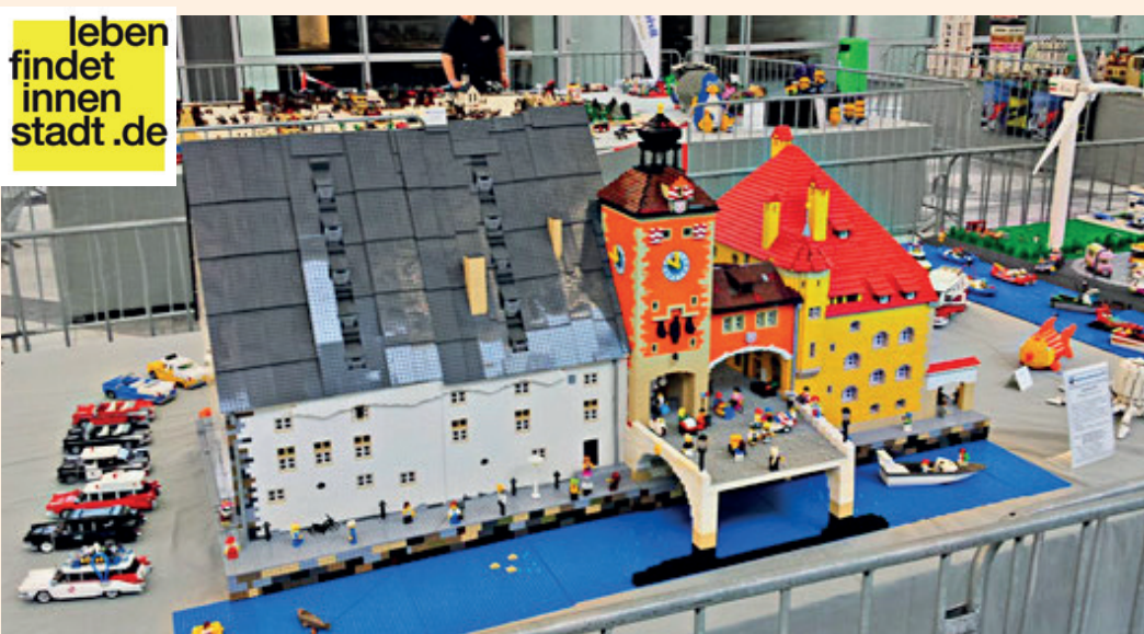
■ Alles aus LEGO-Steinen gebaut - auch das Tor zur Steinernen Brücke, Regensburg