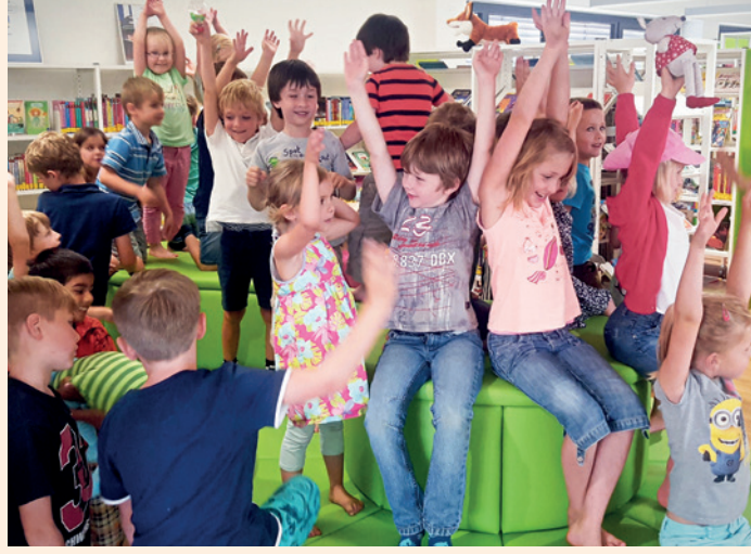
Das neue „Haus für Kinder“ wird in Schierling dort gebaut, wo die jungen Familien leben

Energetisch optimal Der Plan stammt vom Würthler Architekturbüro Manfred Winkler. Etwa 800 Quadratmeter überbaute Fläche hat das eingeschossige Gebäude und mit 3.865 Kubikmeter