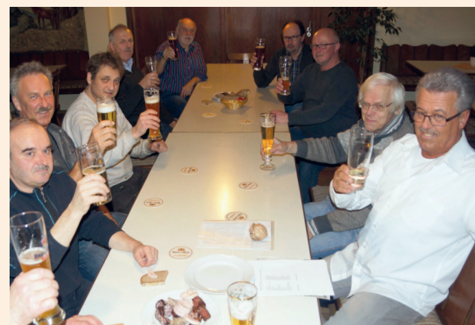
Ein Prost auf die seit über 17 Jahre währende Freundschaft am „Geräucherten-Stammtisch“

SCHIERLING. Das Kürzel „GST“ in der Tageszeitung sorgt seit einigen Jahren für Verwirrung, Unterhaltung und Skepsis zugleich. Dahinter verbirgt sich der „Geräucherten-Stammtisch“, und der trifft sich jeden Donnerstag im Gasthaus Holzner. Die angekündigten Themen klingen mystisch und überheblich zugleich, denn es geht einerseits um weltpolitische Themen und andererseits werden die Mitglieder zum Beispiel aufgefordert, „Nudelwoigler und a Kochschürzl nicht zu vergessen, damit Drahdewitschgerl ohne Mehl gebacken werden können.“